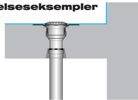
Serie V-FL med klæbeflange til altaner med tætning af flydende kunststoffer, med rustfri stål, rund, uden rørgennemføring